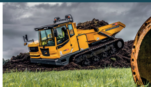
C912s | Rundmulde