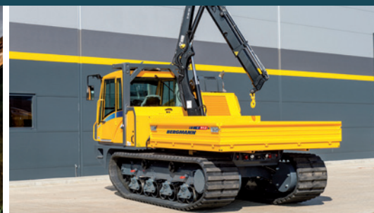
C912s | Trägerfahrzeug