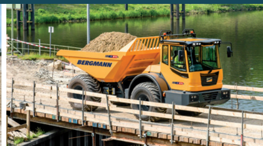
C815s | Rundmulde