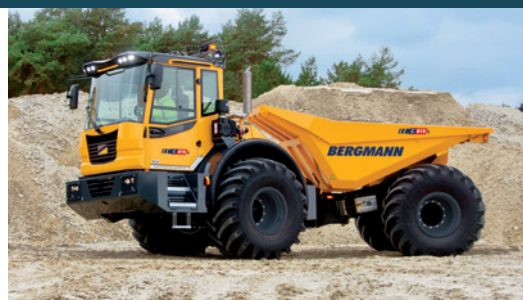
C815s | Heckmulde