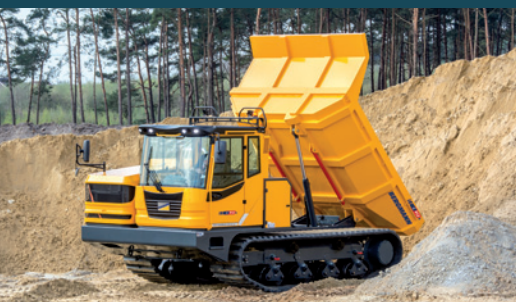
C912s | Heckmulde