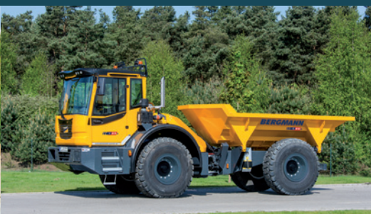
C815s | Dreiseitenmulde